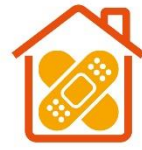
家にばんそうこうをつけて修繕を表現