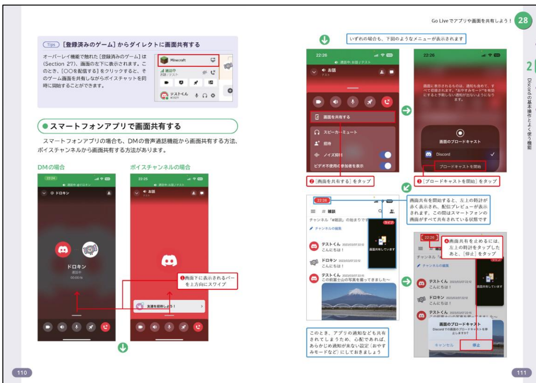
パソコンとスマートフォンの両方の使い方もフォローしている