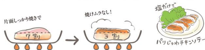
表7割、裏3割の感覚で焼く！

紹介しているコツは、複雑なことは一切なく、「表7割、裏3割の感覚で焼けば、お肉も皮パリジューシーに」「失敗の多い炒め物は、重ねて焼いてから炒める」など、今日からマネできるコツばかり。料理初心者や、料理が苦手な学びなおしたい人にピッタリな内容となっています。