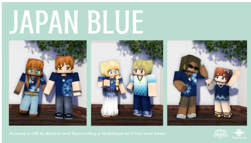
絞り模様や刺し子柄がアクセントのカジュアルな藍染スキン。様々な藍の色味を楽しめるスキンパックです。