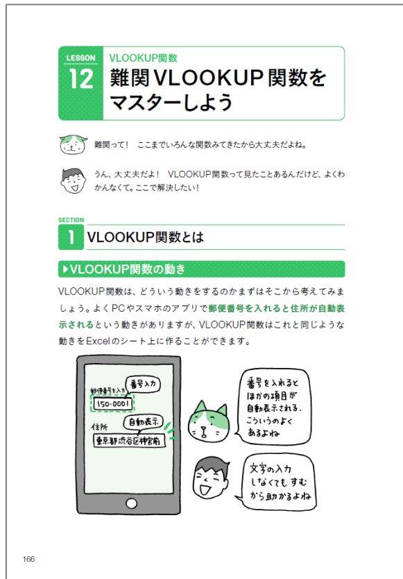
覚えると便利なVLOOKUP関数の使い方も懇切丁寧に解説