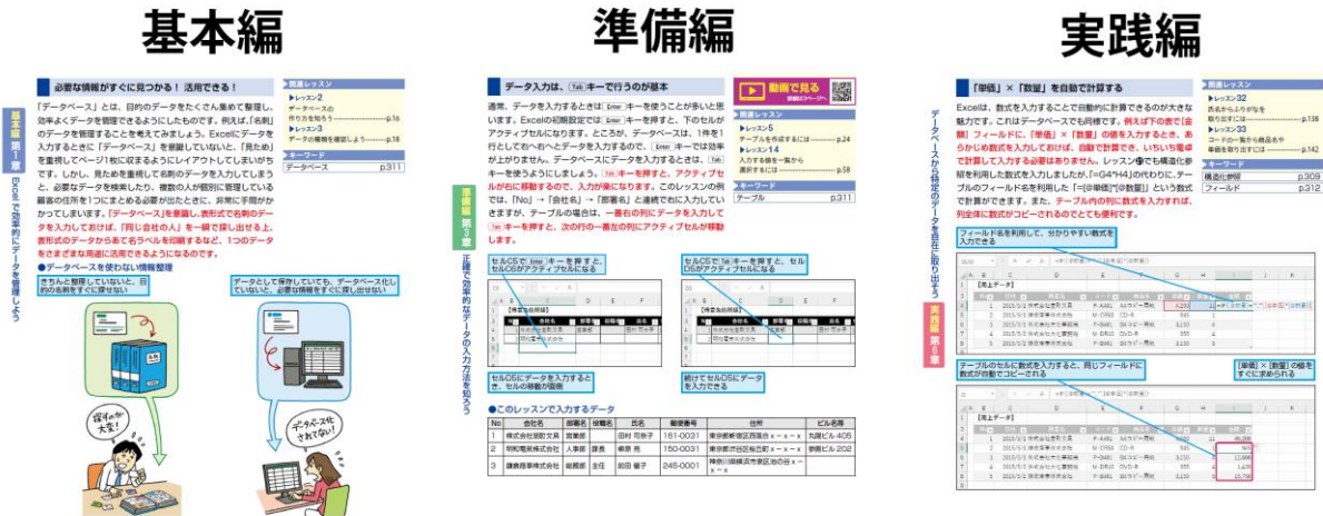
三部構成でデータベース作成の流れが身に付けられる

本書はデータベースの前提知識をまとめた「基本編」、データの入力や整形の方法をまとめた「準備編」、蓄積したデータベースから思いのままにデータを取り出す方法をまとめた「実践編」の三部構成で、データベース作成の流れを学べます。通読すれば、Excelの機能についての知識だけでなく、データを正しく取り扱うための素養も身に付けられ、機能的なデータベースを効率よく作成できるようになります。