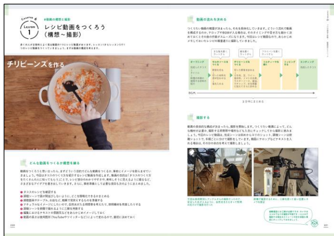
動画づくりにおける構想の練り方や撮影方法についても解説