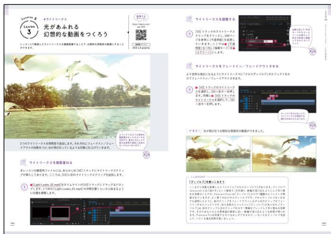
こんな動画が撮ってみたいかった！という魅力的な作例が特長