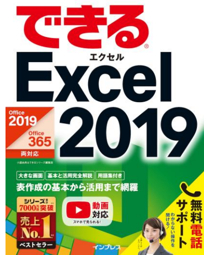
シリーズ第1弾「できるExcel 5.0」(左)と、Excel最新刊「できる Excel 2019」(右)。

以来、「できる」シリーズは25年にわたり、パソコンの利用形態やニーズの変化に応じた様々なサブシリーズを刊行し、無料の電話サポートサービス「できるサポート」を提供（一部書籍を除く）するなど進化を続けています。さらに2014年にはWebサービス「できるネット」( https://dekiru.net )を開設し、インターネット上にも「できる」シリーズのコンテンツ提供を開始しました。