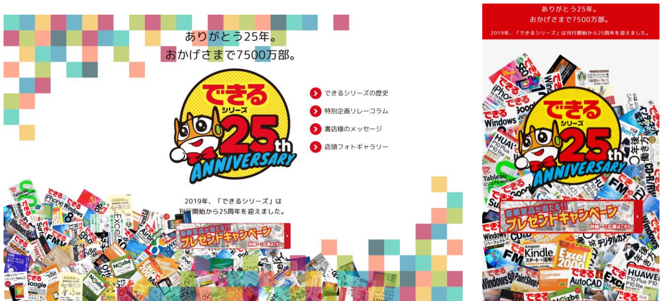
「できるシリーズ 25 周年特設サイト」 https://dekiru.net/25th

「できる」シリーズ25周年を記念して、本日3月1日（金）に「できるシリーズ25周年特設サイト」を開設し、豪華賞品が抽選で当たるプレゼントキャンペーンの受け付けを開始いたしました。プレゼントキャンペーンへの応募期間は本日3月1日から6月30日までで、賞品の発送先が日本国内であることなどの条件を満たせば誰でも応募できます（オープン懸賞）。