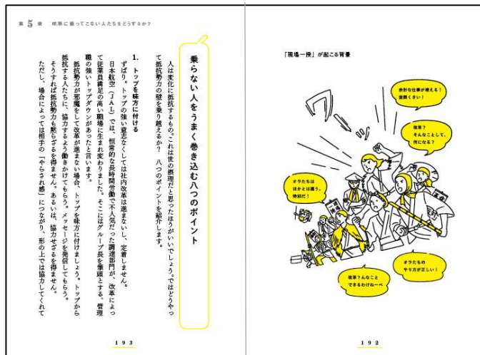
現場と改革推進者の声が見える、紙面デザインやイラスト。